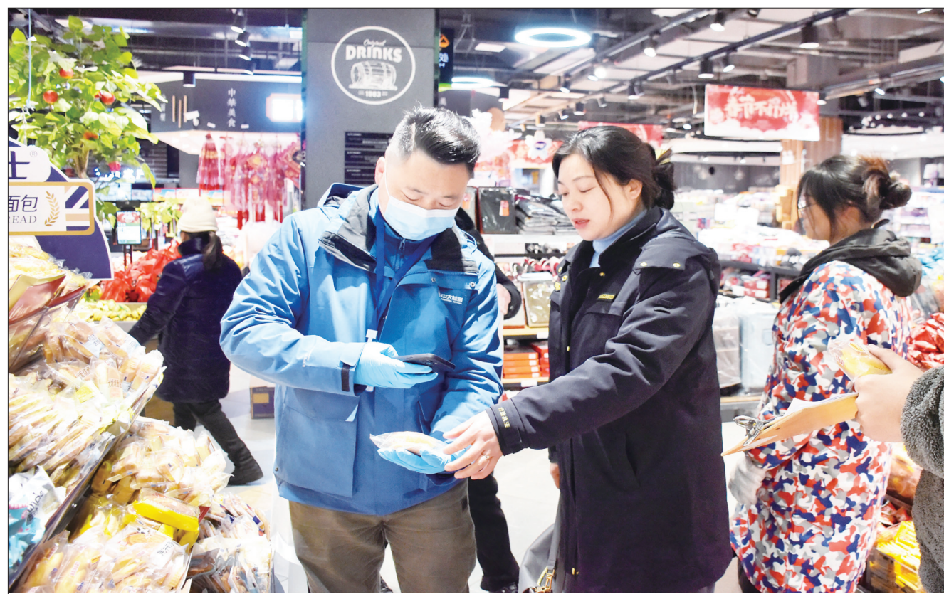
1月25日,新邵县市场监督管理局开展“年关守护 你点我检”行动,为节日期间食品安全“保驾护航”。此次专项行动共抽样300批次,重点聚焦粮食加工品、食用油等。

人群中,一批身穿红马甲的志愿者格外显眼。他们热情帮助乘客购票取票、端茶倒水、搬运行李。邵阳北站与新邵县坪上镇志愿者联合开展“情满旅途·暖冬行动”,保障旅客出行体验和健康安全。一名当地的大学生志愿者说:“志愿服务期间,我将尽我所能为旅客提供热情、周到的服务,切实让旅客感受到回家的温暖。”