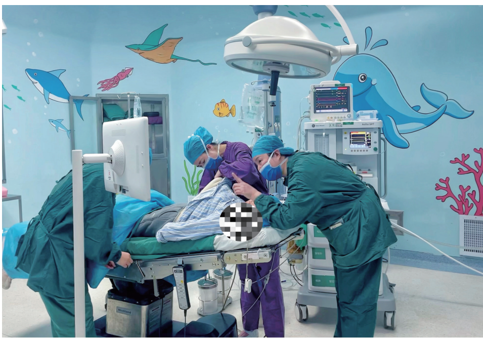
▲“海底世界”主题手术间里,护士和小患者沟通。