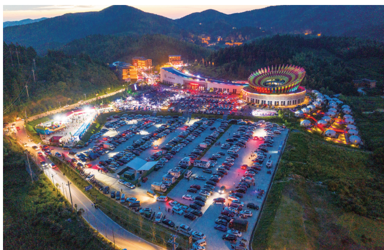
虎形山大花瑶景区游客中心。

年初,该县先后举办了首届油菜花节、“早安隆回·云上花瑶”焰火秀、“健康邵阳·早安隆回”健康跑、首届湖南民族电影展、“早安隆回·云上花瑶”首届房车露营云上音乐美食季、“讨僚皈”纪念活动等“神韵雪峰·云上花瑶”非遗音乐会等多场文旅活动,助力全域旅游不断升温。今年7月以来,魏源故居的游客接待量超2万人次,同比上涨30%;今年夏季,虎形山大花瑶景区游客接待量突破100万人次。随着第二届邵阳旅游发展大会的正式开启,隆回全域旅游必将迎来新的高光时刻。