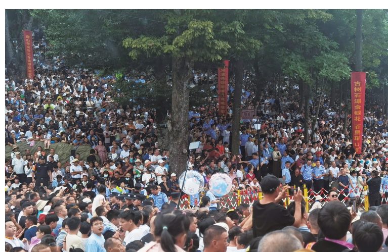
今年8月,虎形山大花瑶景区举行“神韵雪峰·云上花瑶”非遗音乐会,期间游客如潮。

“泛舟夫夷江上,携手浪漫良山;放歌‘早安隆回’,起舞‘云上花瑶’。”今日,第二届邵阳旅游发展大会在隆回盛大开幕。流传着九龙回首美丽传说的隆回,自然风光旖旎,人文积淀丰厚、民俗风情奇异。境内拥有国家各类景观113处,其中,国家4A级景区1个、国家3A级景区5个,还有国家非物质文化遗产滩头年画、花瑶挑花、呜哇山歌和滩头手工抄纸等。以文塑旅,以旅彰文,隆回在新时代的征程中展现出“魏源之智固自强,云上花瑶钟神秀,滩头古镇藏瑰宝,和美向家话振兴,美丽之城映资江”的瑰丽画卷,唱出“三湘大地多胜景,一入隆回不思归”的深情和音。今日,百万隆回人民盛情相邀:让我们相遇“早安隆回”,相约“云上花瑶”!