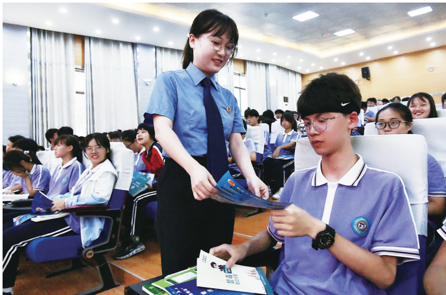
检察官在向学生发放宣传资料。

9月24日,北塔区人民检察院走进状元中学开展禁毒法治讲座,检察官用通俗易懂的语言,向学生介绍了毒品的种类、特征、危害以及毒品犯罪的相关法律知识,并结合多年来办理的真实案例以及例举明星案例等,使孩子们直观、深刻地了解毒品危害及毒品犯罪的严重性,提高自我保护意识和能力。现场还通过有奖问答、发放宣传资料、展示仿真毒品模型等