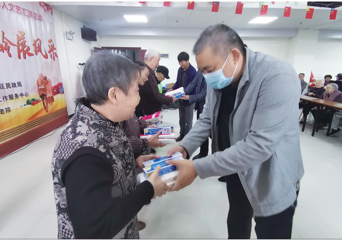
10月14日是重阳节,北塔区民政局和邵阳市新时代社工服务中心在北塔区中心敬老院开展“情满重阳节,银龄展风采”关爱老年人志愿服务活动,主办方给敬老院50多名老人送去面条、牙膏等生活物资,志愿者还精心编排表演了文艺节目。