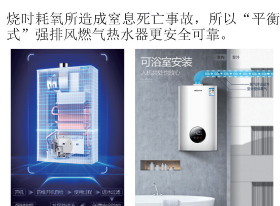
烟道式强制排风燃气热水器工作示意图 “平衡式强排风”燃气热水器工作示意图

3. 误操作不知不觉中将灶具开关打开或忘记关闭灶具开关,造成漏气; 4. 燃气管道故障性中断供气后又恢复供气,而此时灶具开关未关闭,造成漏气。 (二) 为何要选购“烟道式强排风”燃气热水器和“平衡式强排风”燃气热水器? 烟道式强制排风燃气热水器,在使用时氧气助燃靠室内供给,机器内设强制排风风扇,将热水器燃烧后所产生的废气强制排放到户外,可避免下列原因产生的事故: 1. 受房屋层高限制,自然排风能力不足,废气释放在室内; 2. 受外部风向影响,引起废气倒灌。 “平衡式强排风”燃气热水器,在使用时氧气助燃靠室外供给,燃烧后所产生的废气排放到户外,它既具备“烟道式强排风”燃气热水器安全性能,还可避免热水器在燃