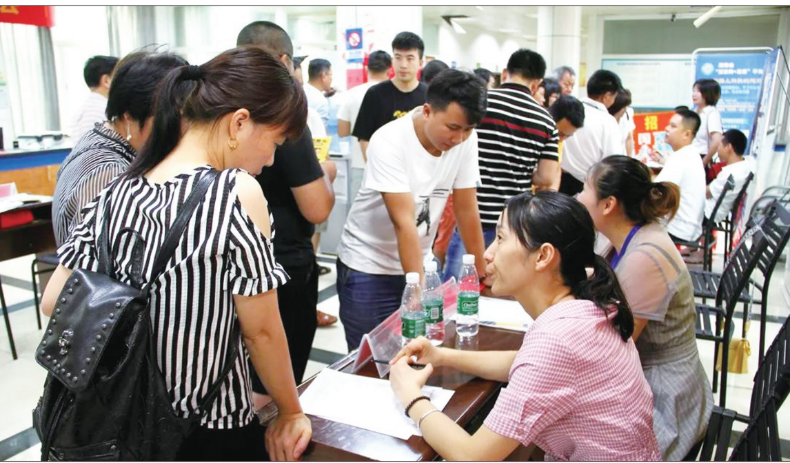
7月29日,邵东市人社局举办2020年“点亮万家灯火”民营企业招聘月专场招聘会,吸引600多名求职者参加,当天有300多人达成初步就业意向。

下一步,邵东市工伤失业保险服务中心将持续推进工伤预防工作,不断创新预防活动方式,在邵东市内重点区域、重点企业进一步深入开展宣传活动,让广大职工和用人单位更加深入地了解相关政策,切实提升企业与职工的参保意识、安全意识,建立更加和谐的劳动关系。