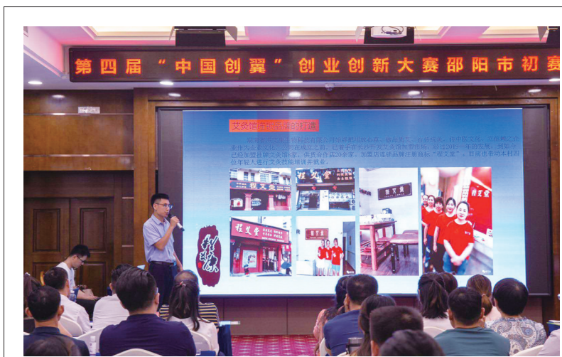
当前,第四届“中国创翼”创业创新大赛邵阳站比赛如火如荼进行中,全市共有62个企业和创业团队报名参赛,覆盖大学生、退役士兵、初创企业主、残疾劳动者等各类就业群体。7月26日,经过初赛的激烈角逐,创新组、创业组、专项扶贫组的15个优秀项目脱颖而出,将于本月进行决赛比拼。图为选手在初赛现场介绍参赛项目。