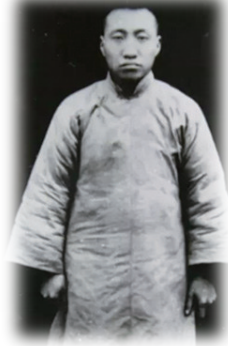
谢伯俞英勇就义前的留影。

3月25日,邵阳市档案馆三楼,寂静的库房深处传来一阵低沉的齿轮转动声。随着档案柜缓缓开启,工作人员小心翼翼地捧出了一卷承载着百年沧桑的泛黄档案。