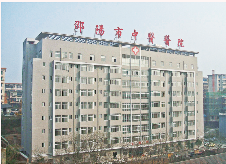
市中医医院矗立蓝天之下,以传承创新中医药文化为基础,守护城市健康,牢固树立起一道生命防线。

为进一步提升特色专科的内涵建设水平,该院积极与国内顶级知名医院和高技术团队合作。2024年8月,该院与湖南省人民医院以“科室共建”模式开展医联体合作,在呼吸内科、胸外科、肝胆胰外科等专业学科方面加强中西医协同发展,有效提高了学科综合能力。同年11月,该院又与中国中医科学院广安门医院就“岐黄学者首都名中医工作室”合作共建工作达成初步意向,拟在心内科、脾胃病科(肝病中心)、肿瘤内二科(消化肿瘤科)、妇科等学科建设上邀请广安门医院进行深度合作,共同推动医院特色专科的高质量发展。