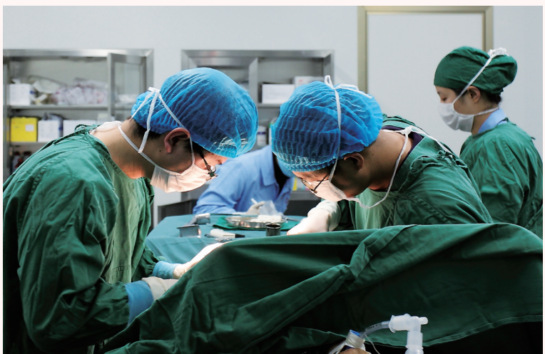
无影灯下,医生们一丝不苟。

此外,该院还组织MDT多学科讨论42次,优化流程,实现各科资源和优势的最大化整合。这一举措不仅提高了诊治质量,还降低了医疗费用,改善患者就医体验。得益于这些举措的实施,2024年该院门诊人次、出院人次、手术人次分别同比增长9.83%、4.2%、8.95%。2024年7月,该院圆满通过三甲复审。