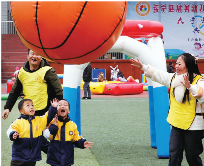
12月21日,绥宁县城关幼儿园在县民族体育馆开展以“大手牵小手 共筑奥运梦”为主题的2024年冬季亲子运动会。