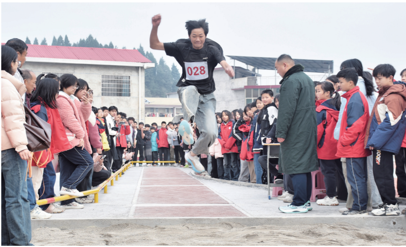
12月20日,隆回县花门街道曾家坳中学举行2024年冬季田径运动会。