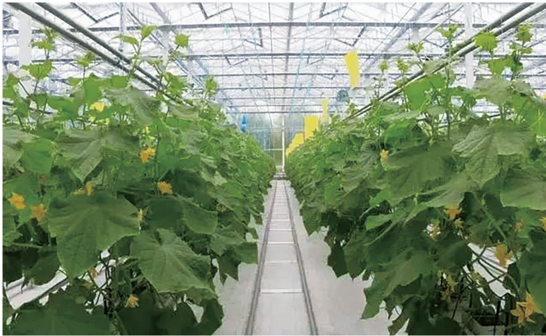
大棚荷兰水果黄瓜。