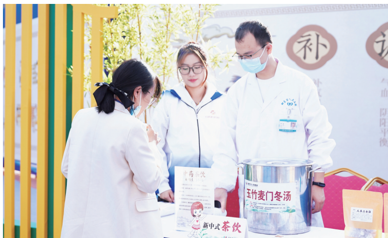
药博会现场设置了中药茶饮品鉴点，为群众提供中药类茶饮。

未来，邵东市将依托药博会，在项目投资、企业对话、市场拓展等方面持续发力，完善生物医药、器械制造、医药物流三大产业体系，积极对接国家战略，抢抓全省千亿中医药产业建设的历史机遇，坚持品质为基、科技为翼，全面推进“中药材+”战略，推动中医药产业与其他领域的深度融合，全力打造中医药产业新生态。