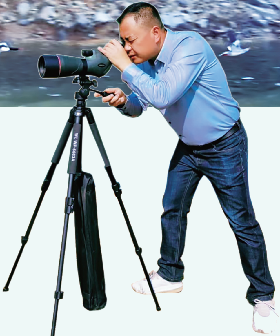
▲工作人员观测候鸟。

据统计，该湿地公园目前迎来的首批“过冬客”，预计有二三百只之多，可能数量还会增加。