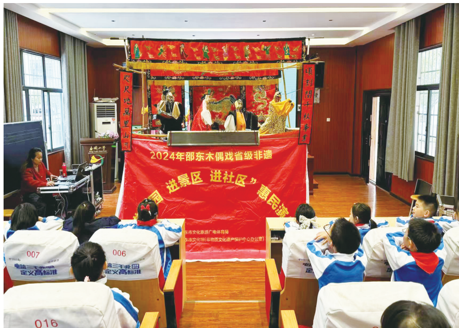
▲邵东木偶戏传承人现场展示非遗技艺。