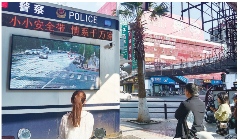
不佩戴头盔者在观看由该大队精心制作的电动车安全警示教育片。