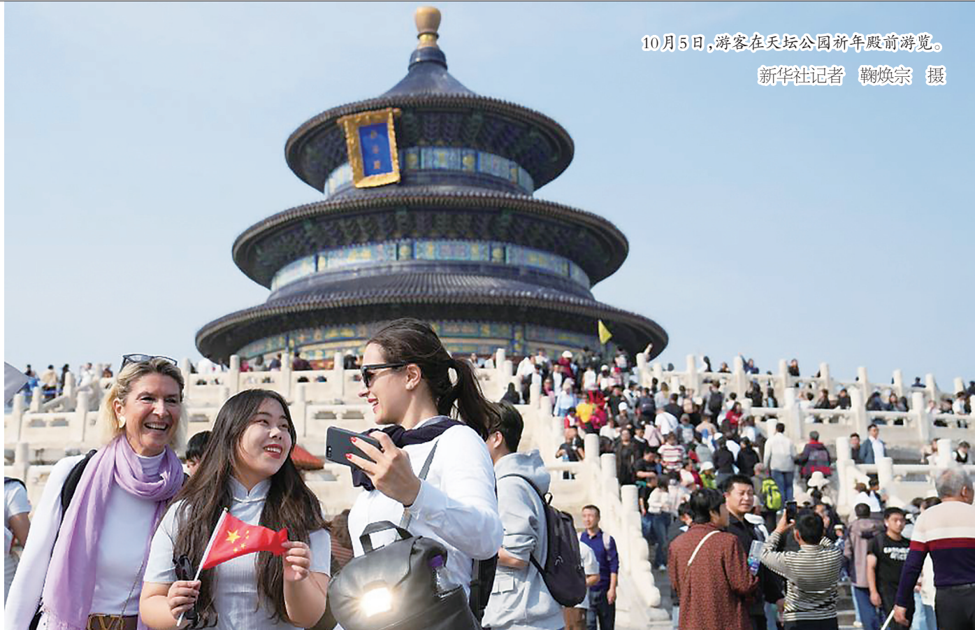
10月5日，游客在天坛公园祈年殿前游览。

音乐节、演唱会等文娱活动异彩纷呈。国家税务总局增值税发票数据显示，假期电影放映、文艺创作与表演、数字文化服务销售收入同比分别增长18.7%、51.7%和178.7%。飞猪数据显示，举办文娱活动的杭州奥体中心体育馆、上海新国际博览中心等成为假期酒店预订热门商圈。