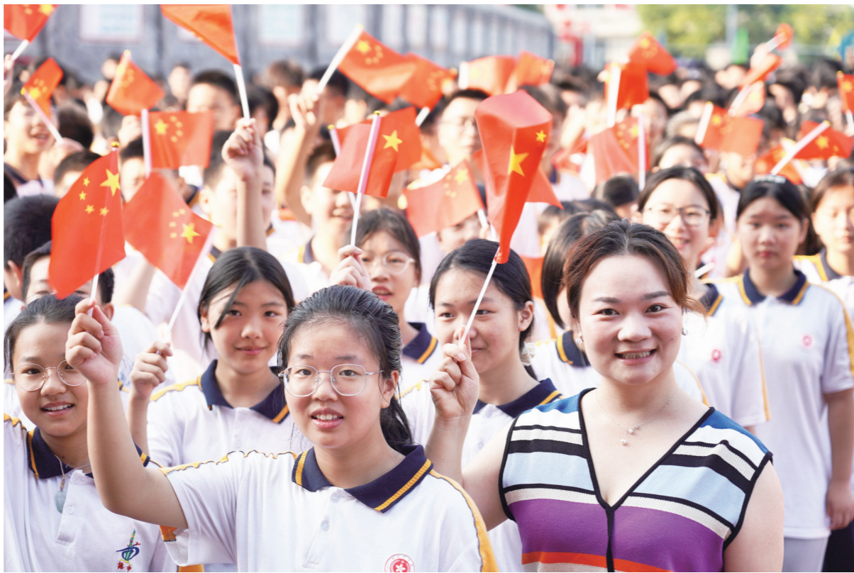
9月30日，隆回县桃花坪中学举行“歌唱祖国 喜迎国庆”大思政活动。全校师生在国旗下誓词励志，歌唱祖国，抒发爱国情怀。