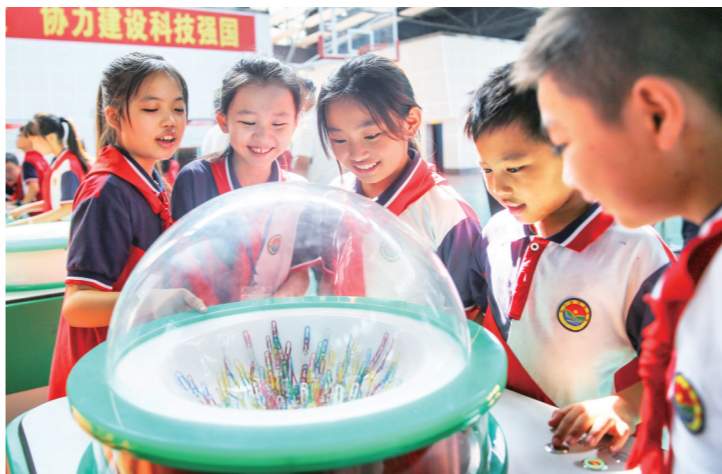
▲9月30日，隆回县梨子园实验学校学生来到中国流动科技馆湖南巡展隆回站参观体验。当日，该校举行“童心向党 强国有我”主题活动，庆祝中华人民共和国成立75周年。

►9月28日，由绥宁县盛夷苗侗非遗文化传媒有限公司组织的民族文化进校园活动在该县长铺镇第三小学展开。芦笙的悠扬、葫芦丝的婉转以及剪纸的灵动，为校园带来了浓郁的民族风情和深厚的文化底蕴。