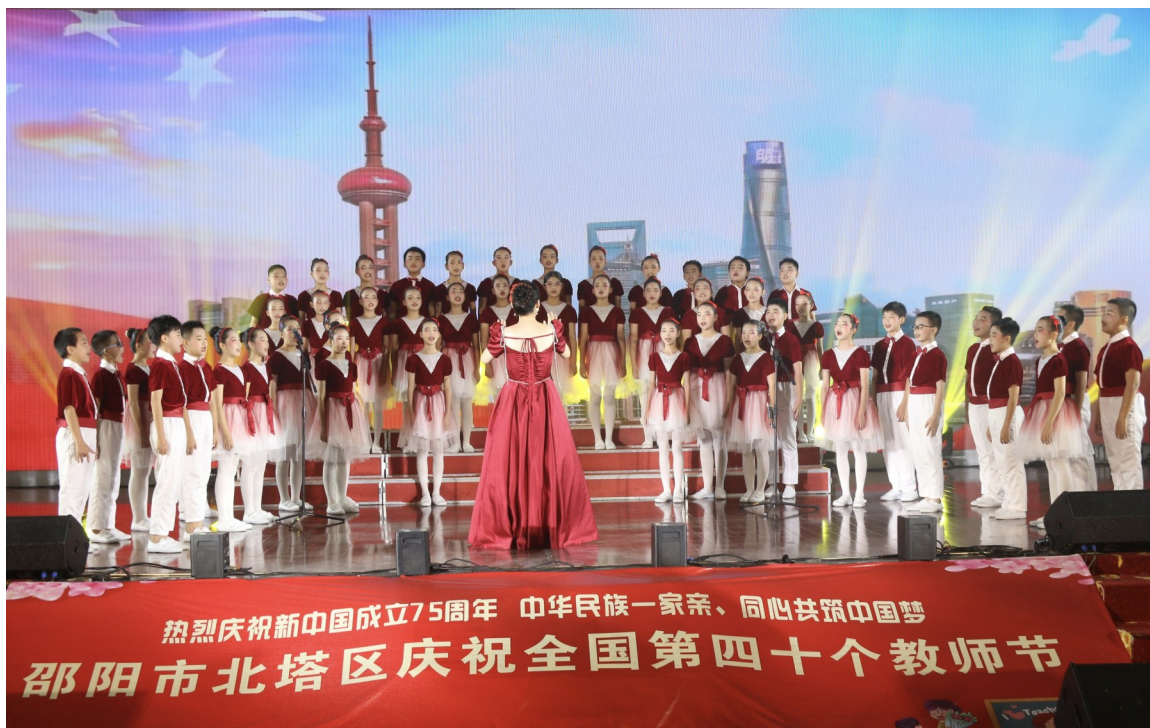
9月9日下午,北塔区举行庆祝新中国成立75周年暨第四十个教师节文艺汇演活动。