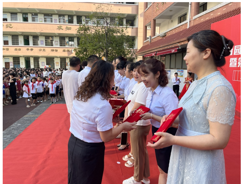
9月10日上午,大祥区百春园小学举行庆祝第40个教师节表彰大会。图为该校“优秀班主任”“师德标兵”正在接受颁奖。