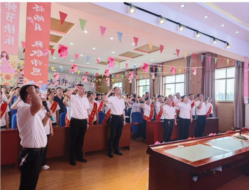
9月10日,在市三中教师节庆祝大会上,全体教职工重温教育誓言,擦亮教育初心,弘扬践行教育家精神,致力立德树人,为教育事业高质量发展作出新的更大贡献。