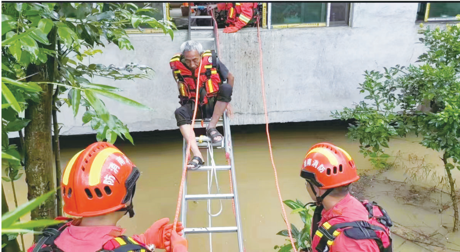
6月24日18时06分,邵阳经济开发区凤元村8组一住房涨水,两位七旬老人被困家中,双清消防紧急救援。