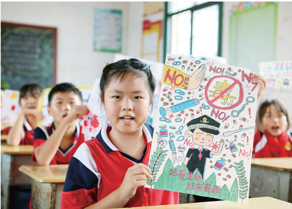
6月24日，城步苗族自治县红旗小学学生展示自己迎接“国际禁毒日”绘制的主题画作。6月26日国际禁毒日到来之际，该校组织参观教育基地、手工绘制画作、学生集体签名等活动，引导学生认识毒品危害、自觉远离毒品。

这个消息告诉了乌龟。乌龟听了，气急败坏地说：“可恶的兔子，这次算你走运，走着瞧吧！”“兔子是个早鸭子。”乌龟对宝葫芦说，“请您把赛道上变出一条小溪吧，我看它还能怎么办！”兔子正在赛道上极速奔跑，突然间多出了一条小溪，这让乌龟疑惑不解，心想：咦！这里什么时候出现了一条小溪？转念一想，还是比赛要紧，别管这些了吧！只见兔子后退几步，快速在地上划几下，咬紧牙关，直接向前冲，再