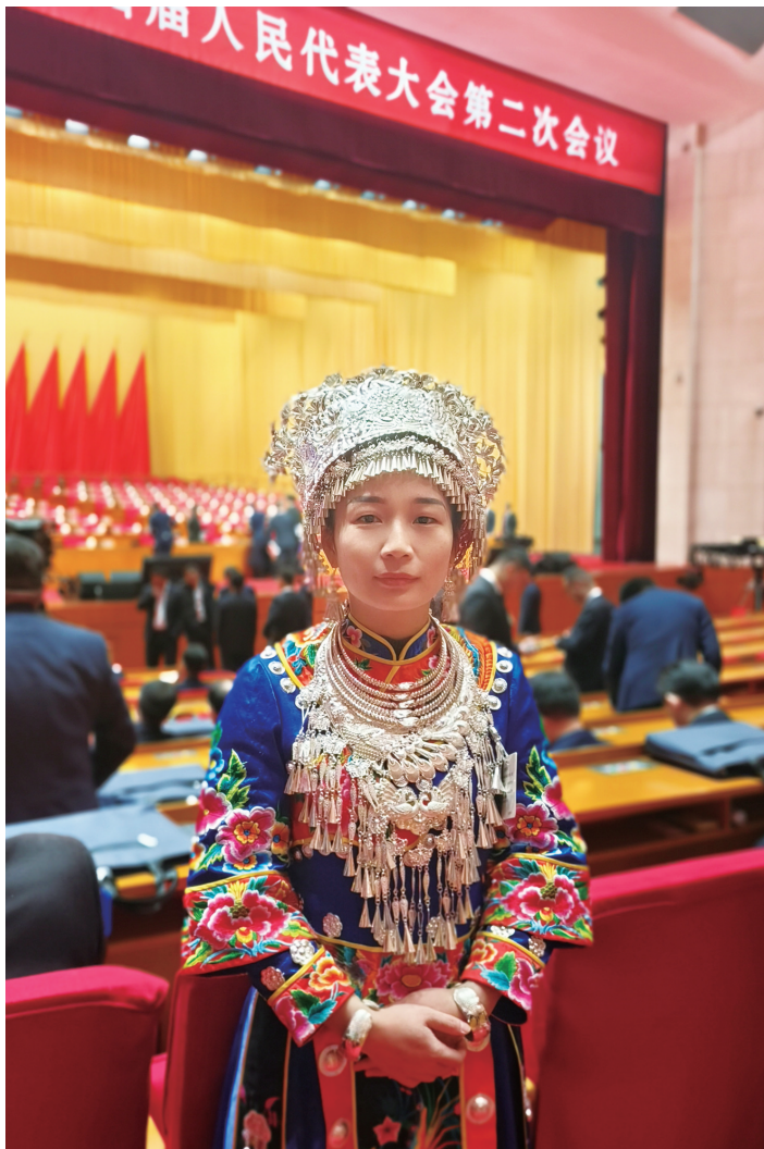
龙乙华出席第十四届省人大二次会议。