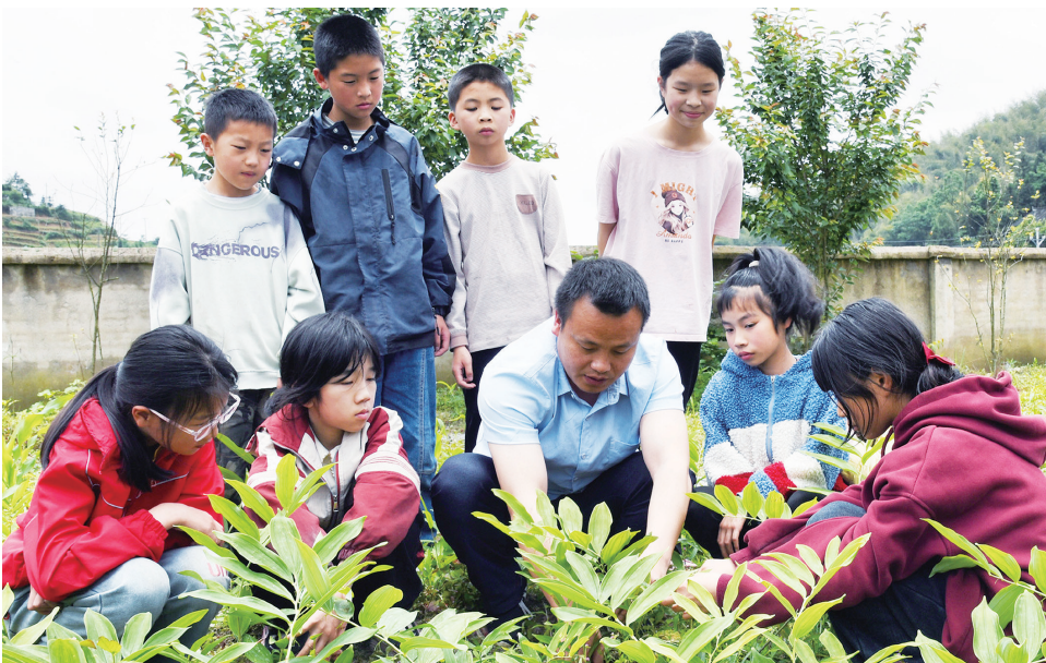
6月7日,隆回县金石桥镇中银小学教师在给学生讲解尾参的生长过程和药用功效。今年,该校建立了280平方米的中草药材种植基地,种植了天麻、桔梗、百合、黄精等30余种中草药,供师生学习了解中草药知识和开展劳动实践活动。