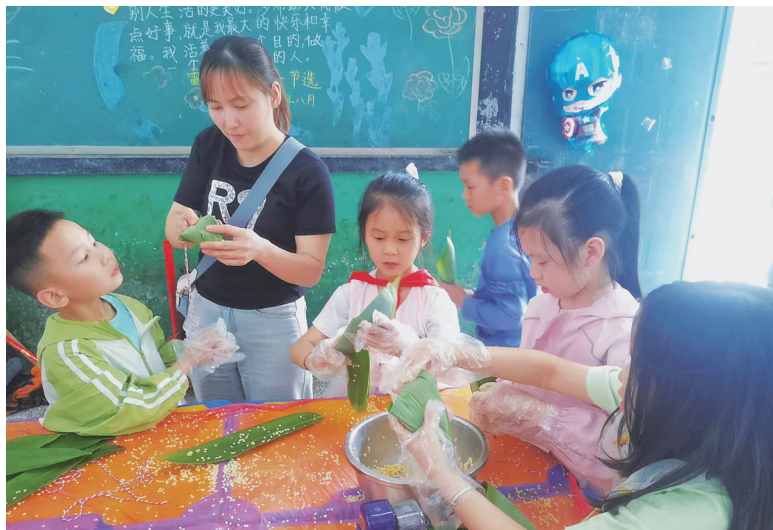
6月6日下午,大祥区西直街小学258班学生在家长的指导下学习包粽子,迎接端午节。

“小将军”顽皮可爱,是我的小玩伴。双清区中河街小学213班 左浩睿 指导老师 申筑竹 姜亚凌