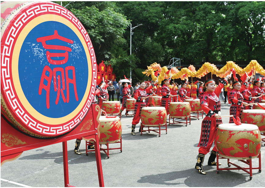
6月6日,洞口县第三中学鼓手在操场打着激昂的鼓声欢送高考学生。当日,该县高桥镇众多群众为当地考生加油鼓劲。