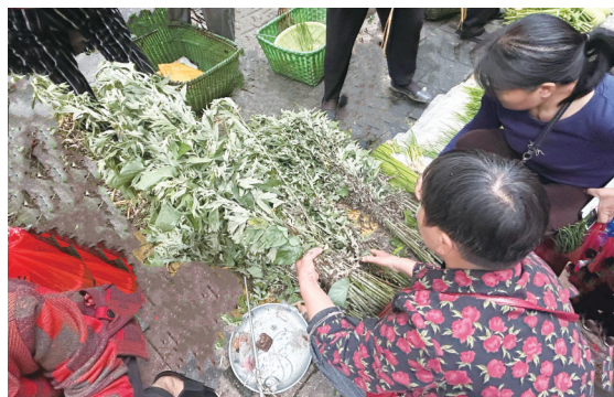
▼三眼井摊位摆放艾草。