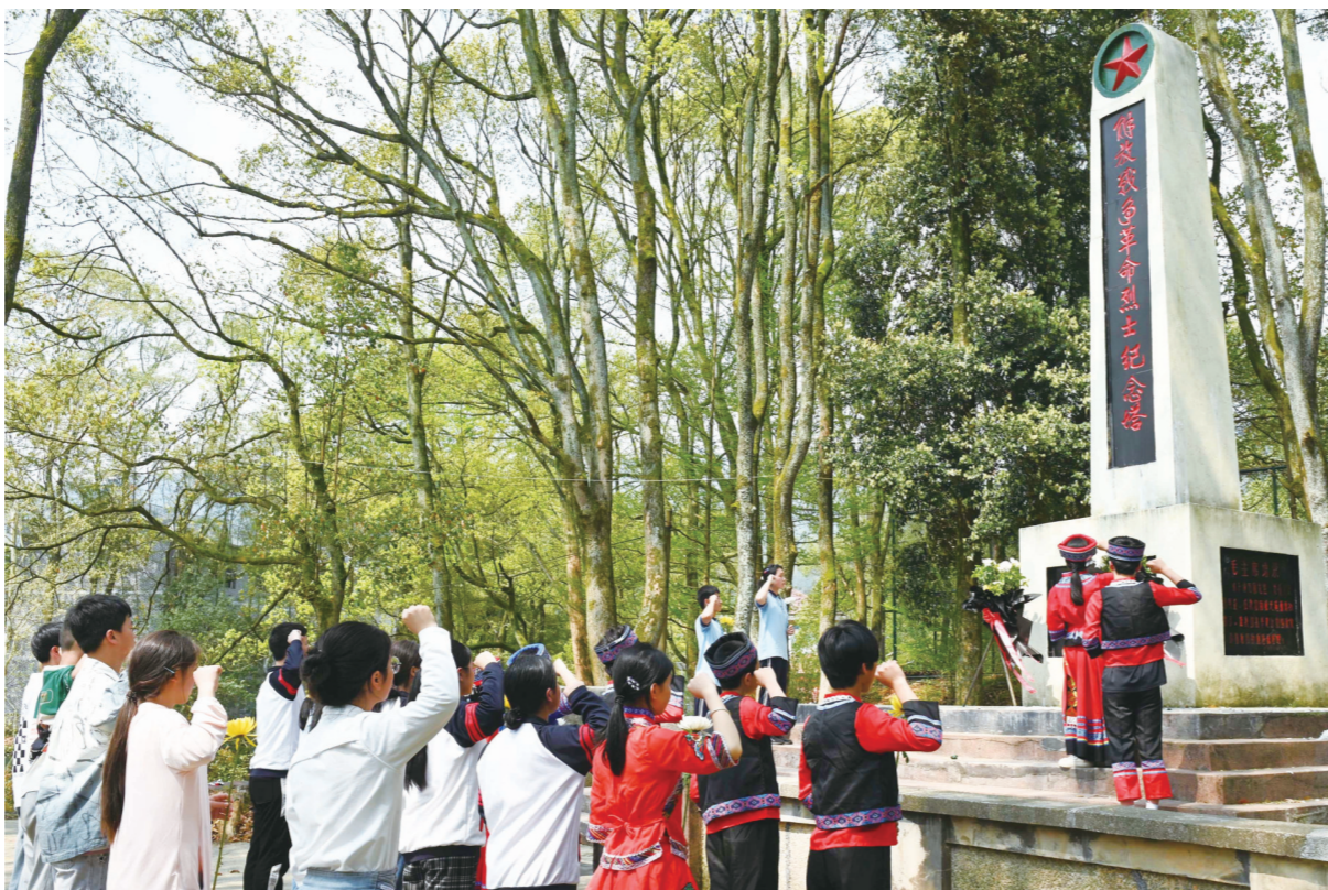
4月2日,洞口县长塘瑶族乡九年一贯制学校的学生在当地解放战争革命烈士纪念馆前祭奠烈士英灵,传承和弘扬爱国主义精神。