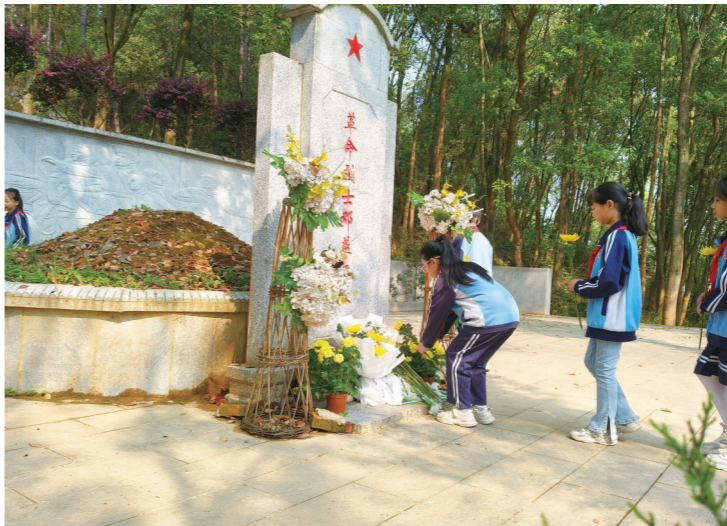
4月2日,北塔区高樟小学组织四年级学生到邓益烈士纪念馆开展扫墓活动,师生代表们怀着崇敬之情,向邓益烈士敬献花圈。