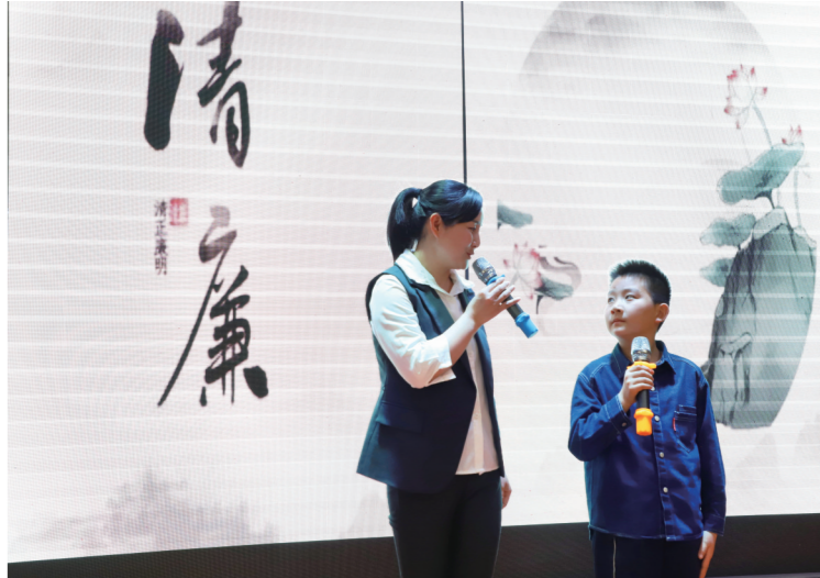
3月30日,武冈市开展“好家风·好传承”主题活动,通过看警示教育片、观清廉皮影戏、谈家风建设、听亲子诵读等形式,100多户家庭现场感受好家风的力量。图为《清廉家风》亲子诵读现场。

春天到了,小草们迫不及待地钻出土地,与人们分享春天到来的快乐。它们为大地盖上绿地毯。这无数的小草,让我感受到生命的伟大。