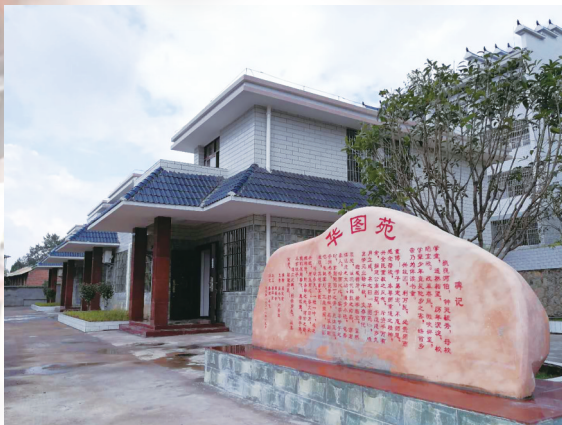
多年的定向帮助,让河伯学校的校园面貌焕然一新。