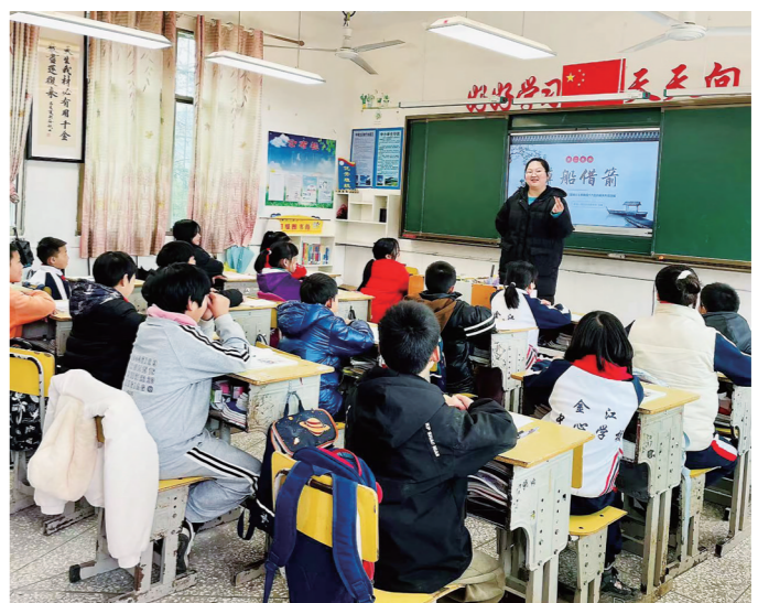
为激励教师深入开展课堂教学理论探索与实践创新,提高教师教学教研能力,3月18日,邵阳县金江乡中学举行教师学科竞赛活动。

得更加娇美。我与阳光也成了知音。太阳一探出脑袋,阳光马上照耀大地,花上、叶上的水珠如珍珠一般晶莹,在阳光下闪闪发光。即使有时我藏在小沟里,只要被阳光照着,不久就能变成了土。尔后,绿油油的草地、郁郁葱葱的森林、生机勃勃的农田都是最好的礼物。我成了大自然的好朋友。绿被我变得更加亮丽,红被我变得更加鲜艳,而粉被我变