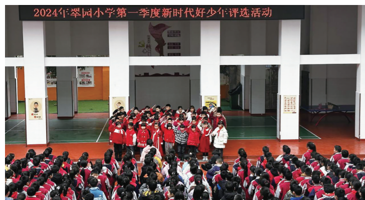
2024年翠园小学第一季度新时代好少年评选活动,评选出校级“新时代好少年”9名。

夏天,那含苞欲放的花蕾绽放出绚丽多彩的荷花,有粉红的、雪白的,好看极了!一阵微风吹来,荷花情不自禁地跳起了舞蹈。池子里的小鱼也活跃了起来,有的半露着身子晒太阳,有的在水中嬉戏,有的使劲吐“泡泡”,让身子下潜。岸上,知了在抱怨天气的炎热,时常还会引来几只蜻蜓在池面点水呢!秋天,荷花已经凋谢。秋雨浙