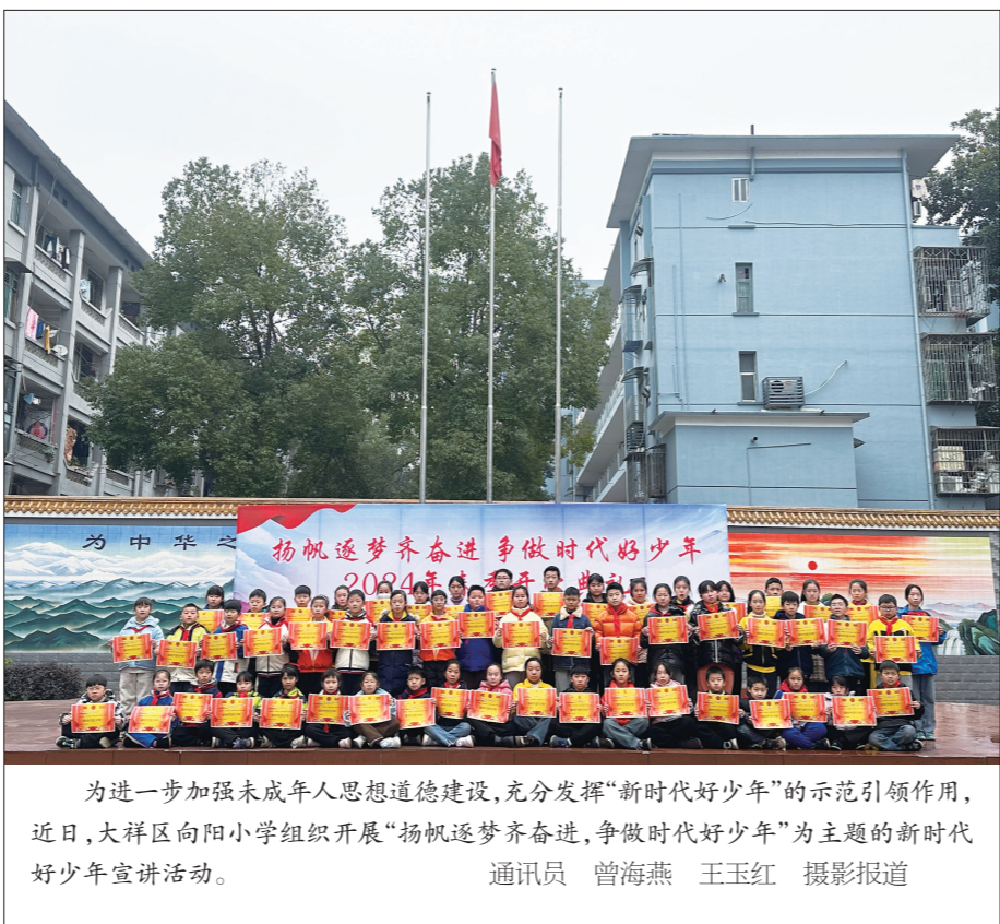
为进一步加强未成年人思想道德建设,充分发挥“新时代好少年”的示范引领作用,近日,大祥区向阳小学组织开展“扬帆逐梦齐奋进,争做时代好少年”为主题的新时代好少年宣讲活动。