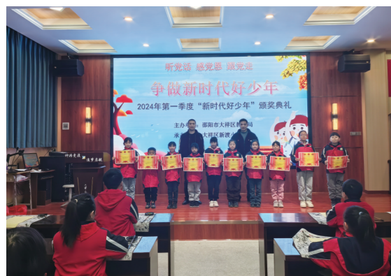
3月4日上午，大祥区新渡小学举行了2024年第一季度“新时代好少年”颁奖典礼。

随着春节的临近，年味儿也愈发浓厚。我喜欢这种感觉，它让我觉得生活充满了期待和喜悦。 年味儿从哪里来呢？首先，是从街头巷尾的热闹开始的。店铺的门口挂上了红红的灯笼，店铺里也摆满了各式各样的年货。人们忙着选购年货、新衣，脸上都洋溢着期待的笑容。这种热闹的氛围，让我感受到了年味儿的浓厚。 年味儿也从家人的团聚中散发出来。临近春节，每到这个时候，不管身在何处的人们，都会回到家里与亲人团聚。这些温馨的时刻，让我感受到了年味儿的温暖。