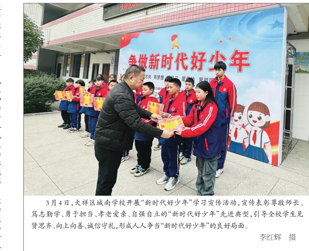
3月4日，大祥区城南学校开展“新时代好少年”学习宣传活动，宣传表彰尊敬师长、笃志勤学、勇于担当、孝老爱亲、自强不息的“新时代好少年”先进典型，引导全校学生见贤思齐、向上向善、诚信守礼，形成人人争当“新时代好少年”的良好局面。

做家务。妈妈真是一只勤劳的“小蜜蜂”啊！ 我的爸爸就像一只“老虎”，发起火来特别恐怖。爸爸最爱在手机上下象棋，不管是在家里，还是在外边，只要有时间他就拿着手机下个不停。“老虎”爸爸炒的菜十分好吃，蘑菇炒肉、香蒸鲑鱼、清蒸基尾虾、青椒炒蛋……都是爸爸的拿手好菜。只要他一做拿手菜，我们