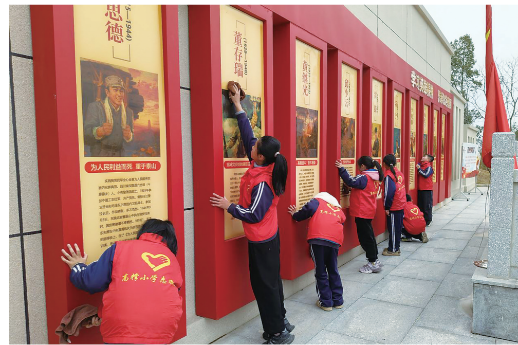
3月4日下午，为弘扬雷锋精神，北塔区高撑小学组织学生到红色教育基地思益广场开展志愿服务，把学生学习、生活的每一处细节演变成一种雷锋精神的浸润力、成长力。

有人喜欢高贵典雅的牡丹花，有人喜欢芳香扑鼻的玫瑰花，也有人喜欢绚丽多彩的月季花，而我喜欢梅花。 梅花有红色的、黄色的和粉色的，远看就像一朵朵五颜六色的云。走近一看，它的花蕊是一根一根的，上面有几个比芝麻还小的黑点，闻起来的时候有一股淡淡的清香。 你看，在这寒风凛冽的冬天里，梅花还可以生存。梅花就是靠着这种坚持不懈的精神，在风雪交加的冬天里活了下去，为这草木凋谢的冬天增添了一抹色彩。 梅花既不要温室一样的环境，也不要肥沃的土地，只