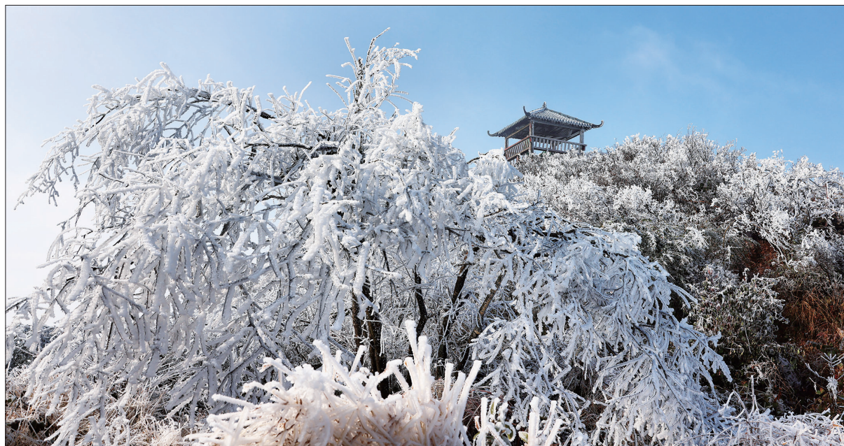
12月20日，邵阳县河伯乡河伯岭山上银装素裹，晶莹闪烁的雾凇缀满山头，玉树琼花分外迷人。