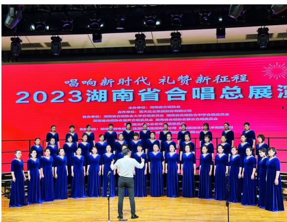
市音协合唱团参加全省合唱总展演比赛。

市音协合唱团给邵阳合唱艺术爱好者提供了一个展示自我、相互交流的平台。近年来,在市文联、市音乐家协会的大力支持下,该团团员们用优美的歌声赞美新邵阳,讴歌幸福生活,抒发了对党、对祖国、对人民的无限深情与热爱,为邵阳合唱艺术的繁荣和进步作出积极贡献。