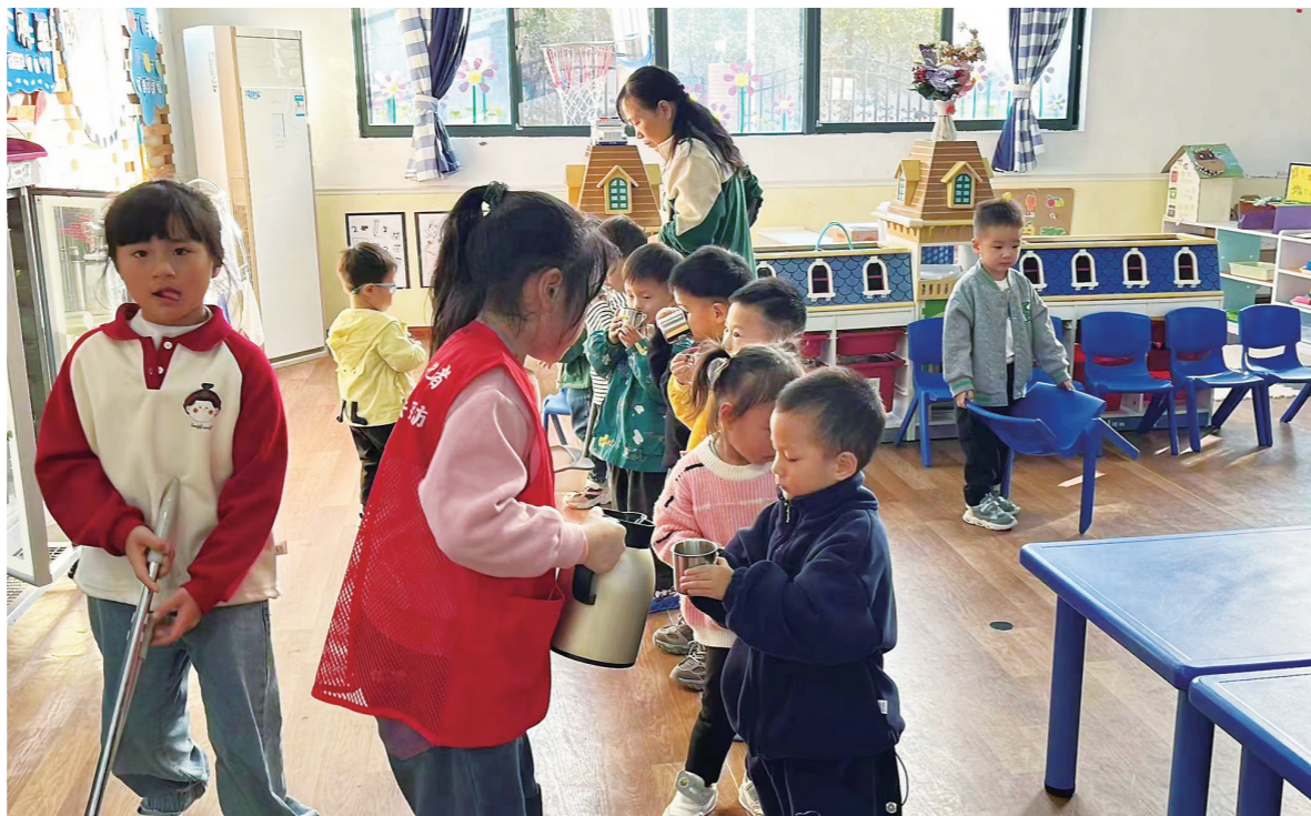
近日,大祥区百春园小学的邵阳日报小记者在记协老师的带领下,走进伊索幼稚园开展“小鬼当家——今天我是小老师”职业体验活动。活动中,小记者们协助班级老师照顾弟弟妹妹们穿衣服、叠被子、发放晚餐等。