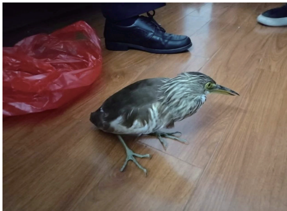
村民在田里捡到的“小可爱”。

池鹭，鹮形目鹭科，属鸟类。池鹭主要分布在东亚温带、亚热带地区和中国。栖息在浅水、咸水湿地和池塘。低地鸟类，活动范围被北部的亚北极地区、西部和南部的山脉所限。常在白昼或黄昏活动，站在水边或浅水中，用嘴飞快地攫食，通常无声，争吵时发出低沉的呱呱叫声。食物包括昆虫、鱼和甲壳类动物。繁殖期为每年的3月至7月，营巢于水域附近高大树木的树梢或竹林上，常成群营巢。每窝产卵2枚至5枚，多为3枚。