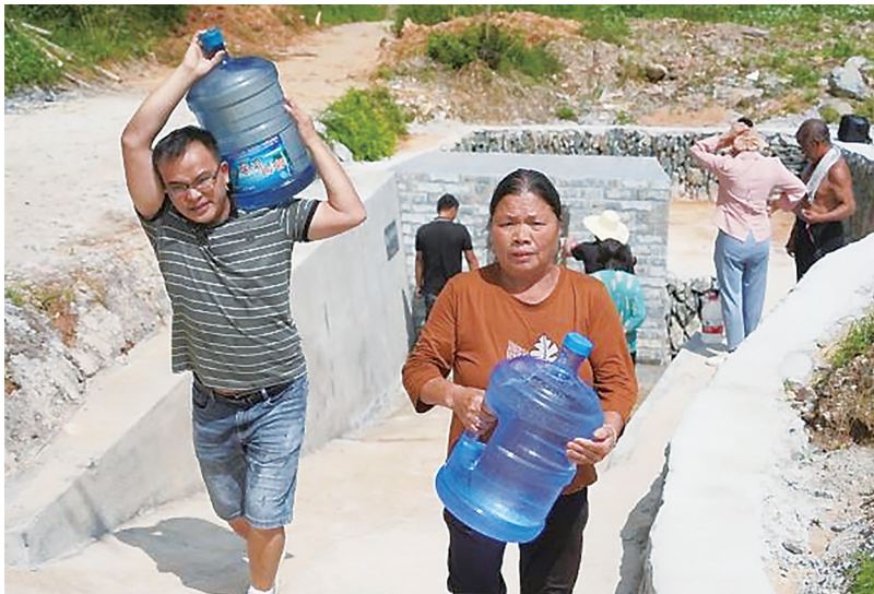
村民在恢复的古井取水。