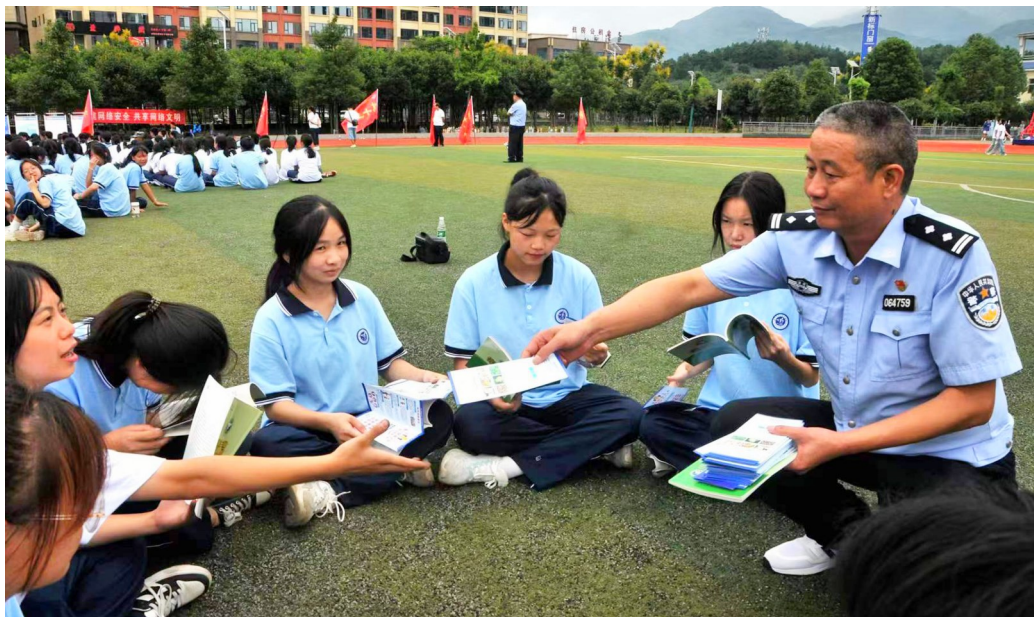
9月12日,新宁县禁毒办民警在夷江职中开展禁毒知识宣传。近期,该县公安局、禁毒办进校园开展网络安全宣传校园日、禁毒日等宣传活动,为青春护航。

最后,民警依法对谢某非法改装的违法行为作出罚款200元的处罚,并责令其将车辆恢复原状。