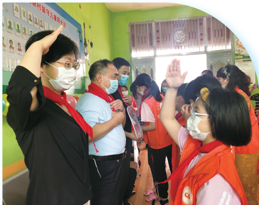
▲5月31日,市民政局、市创文办、市慈善总会、市家庭教育研究会来到大祥区立新村儿童之家,联合开展“童享蓝天,圆梦六一”活动,希望全社会关注关爱留守儿童。