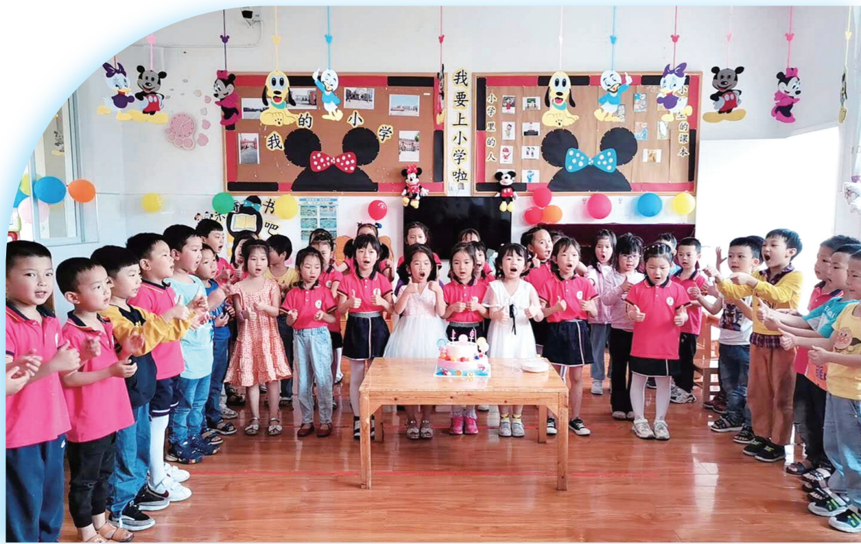
▲6月1日,隆回县幼儿园开展“六一”庆祝活动。当日,该园组织大、中、小班在各班活动室进行了才艺展示、趣味游戏、互送礼物和分享美食等活动。