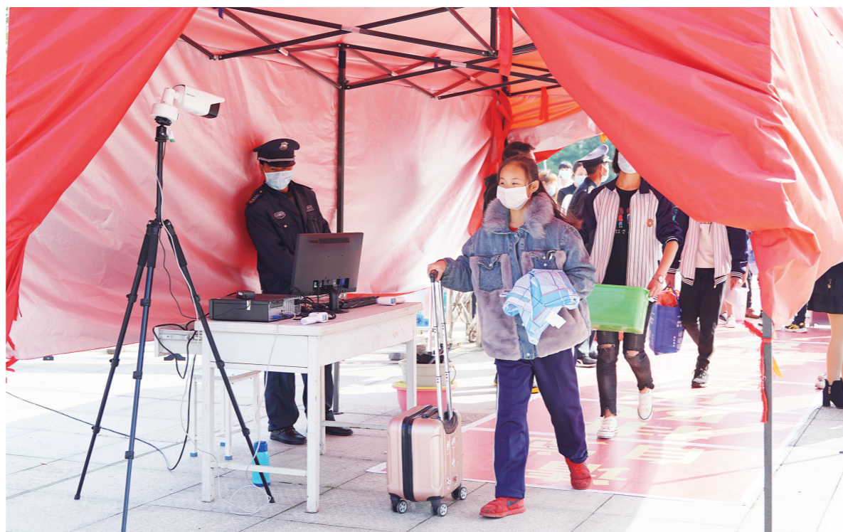
根据统一安排，4月13日，我市2020年春季学期高中一、二年级和初中一、二年级正式开学。为了确保开学期间安全、顺利、平稳，我市各初、高中学校根据我市疫情防控工作的总体安排部署，“一校一策”地制定开学工作方案，储备防疫物资，细化开学流程，尽最大努力将疫情防控下开学各项工作落到实处。 图为学生经过体温检测进入一中新校区。