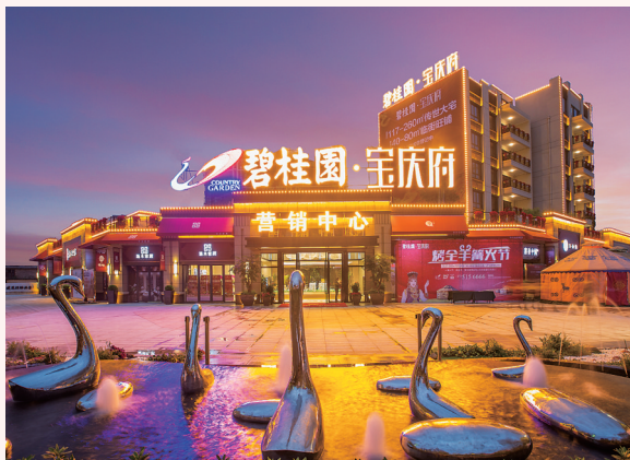
碧桂园·宝庆府营销中心