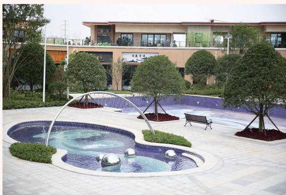
无比惊艳的碧桂园·南城首府。