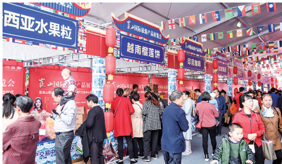
旅游产品销售势头好。