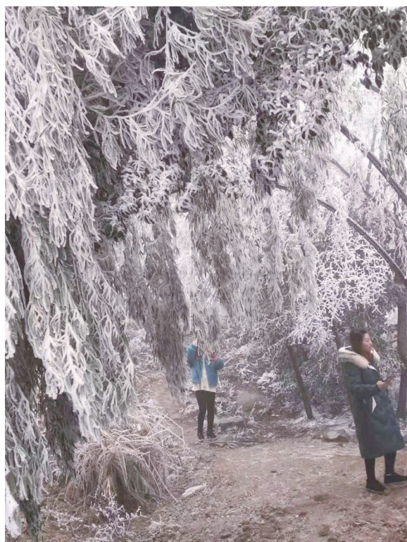
行走在玉树琼花的世界。