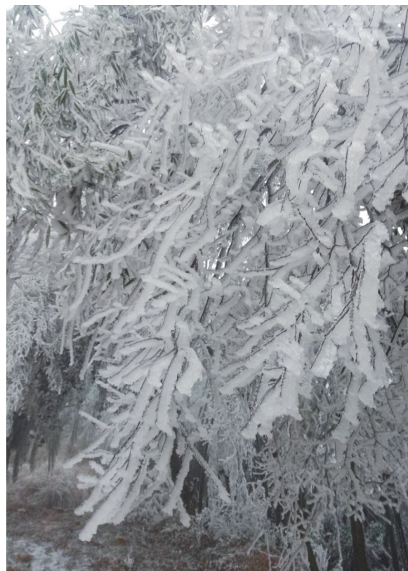
冰雪之景,让人偏爱。