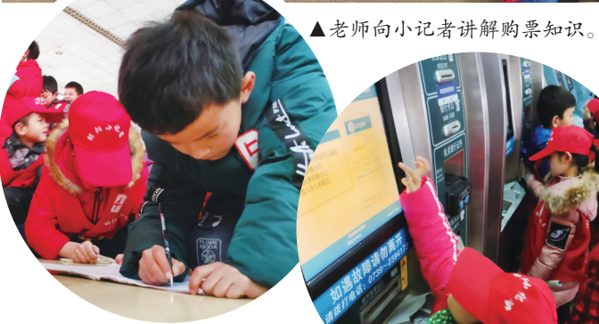
▲小记者们席地而坐,认真记录。