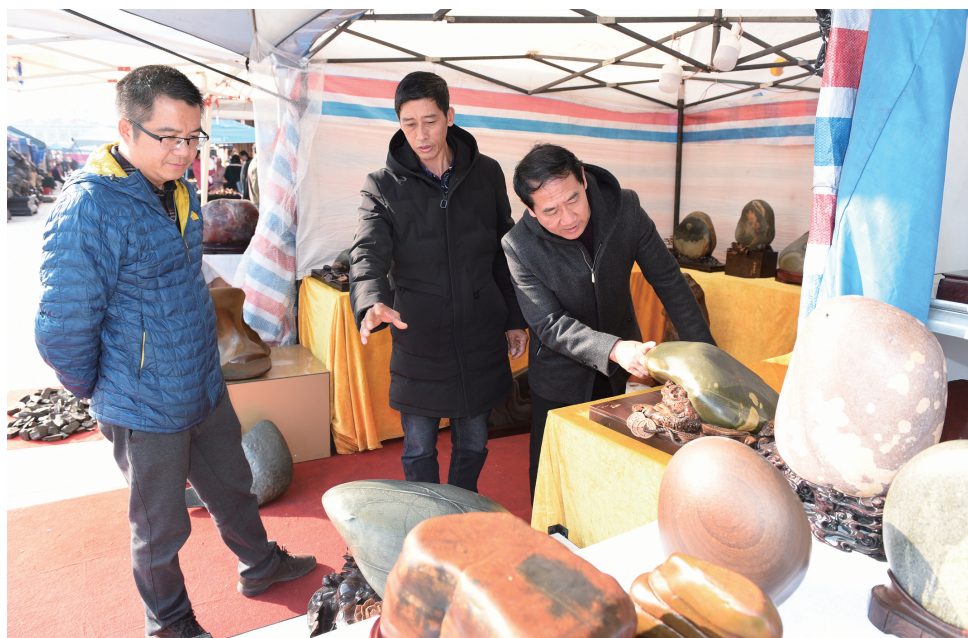
顾客仔细观赏乌江石。