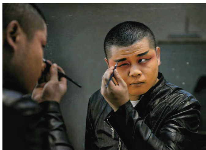
在传统的戏曲演出中,人物的化妆是人物内心世界的直接流露。