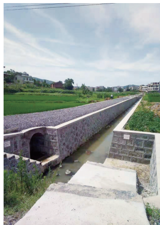
荆竹铺镇三元桥村高标准农田建设项目一角。

在搞好项目建设的同时，武冈市农发办始终强化廉政建设，努力打造一支清正廉洁、作风过硬的农发队伍。近两年，邵阳市审计局对武冈市农业综合开发办项目资金进行了专项审计，没有发现任何违规使用资金的情况，给予了全市资金管理最好的评价。武冈市农业综合开发办始终以“让人民群众满意”为最高目标，努力打造优良民生工程，向党和人民交上了一份满意的答卷。