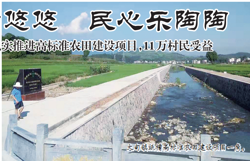
大甸镇高标准农田建设项目一角。

近年来，武冈市农业综合开发办紧紧围绕武冈市委经济工作、市委市政府农业农村工作会议确定的目标任务，以争资立项，抓好项目建设为重点，不断开拓创新，奋发有为，扎实推进高标准农田建设项目，使这一党和政府的惠民工程惠及千家万户。