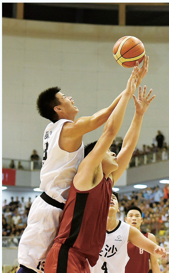
双方篮前角逐。

本次省运会(青少年组)击剑比赛时间为9月4日至6日,全省有长沙、衡阳、株洲、湘潭、邵阳、岳阳、常德、郴州、怀化等市的245名选手参赛。其中,我市选手21名。