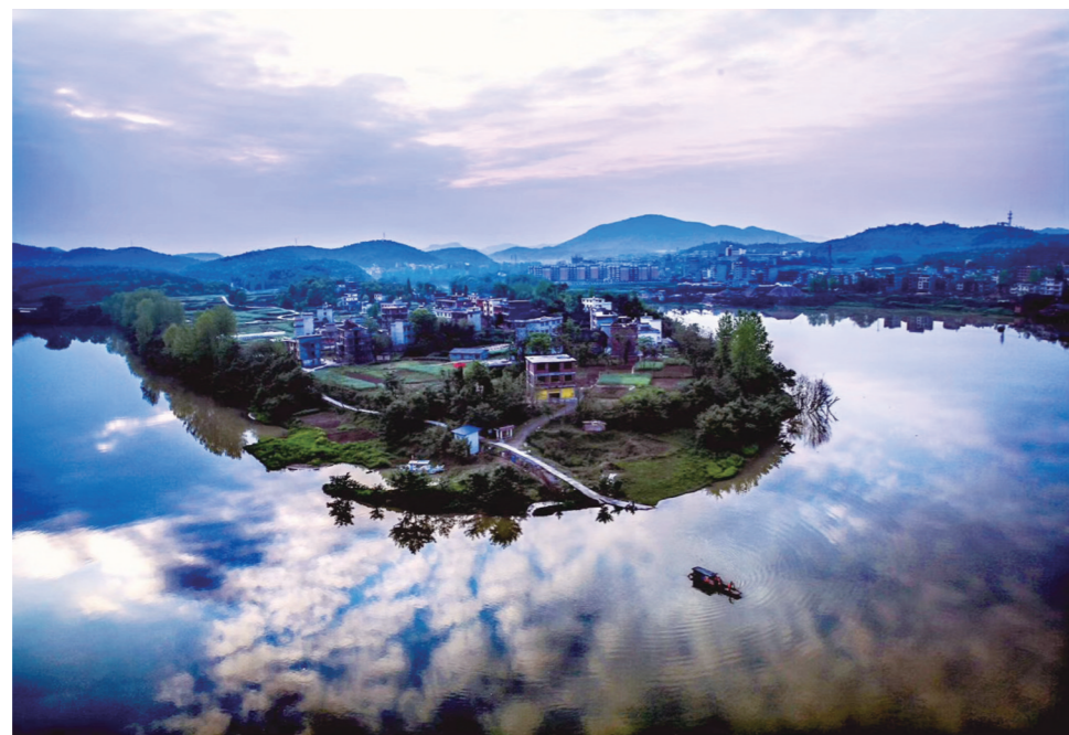
▲ 鱼戏云海