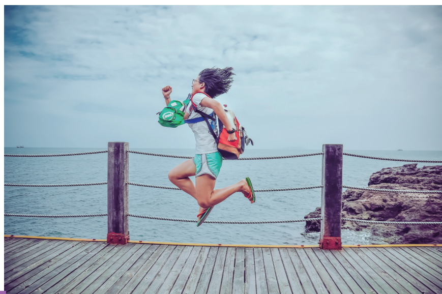
▼ 活力四射