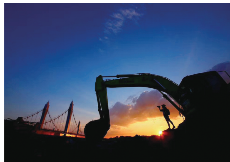
▲ 新桥展新安