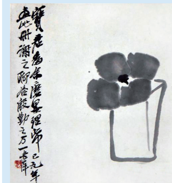
齐白石画作《送宝君图》。