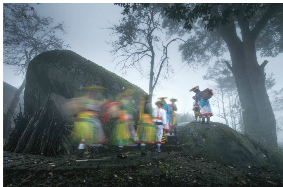
▲ 瑶山丽影