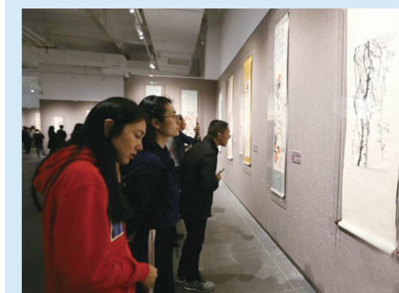
参观者欣赏齐白石画作。

其中,《最后的辉煌》是齐白石生前画下的最后一朵“牡丹”。“你看这牡丹,虽然叶子都已经枯黄了,但花朵还是那么鲜艳,生机勃勃,正是老人当时的写照,他可能知道自己快不行了,但骨子里仍然不屈服命运。”齐秉颐说,这就是湖南人坚韧不拔的精神。