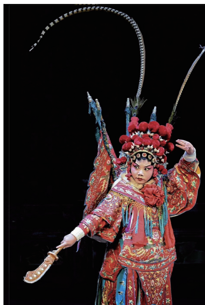
▲ 谁说女子不如男?