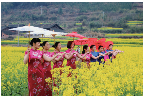
油菜地里的旗袍秀。