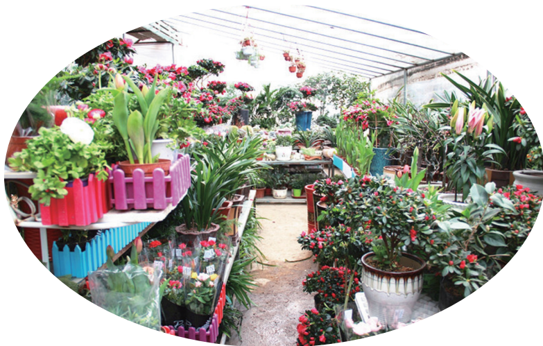
▲店里摆满喜庆的红色花卉。

“现在日子过得越来越红火,我们一家人都很知足。2018年,我将继续努力工作,把生意做大,让家人的生活水平更上一层楼。”宋雪梅说。