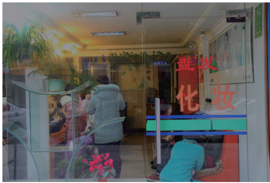
▶张若菲打工的店里坐满顾客。