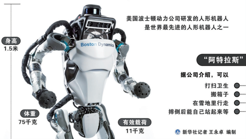
美国波士顿动力公司研发的人形机器人是世界最先进的人形机器人之一