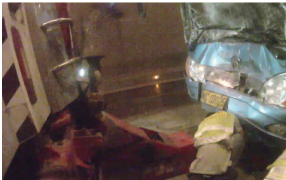
▲施救人员正在将大巴车拖离现场

据客车驾驶员介绍,他当时正常行驶,突然前方货车车头横转,来不及刹车就撞上去了。事故货车驾驶人则告诉民警,他踩一脚刹车,车头就突然横转。“没想