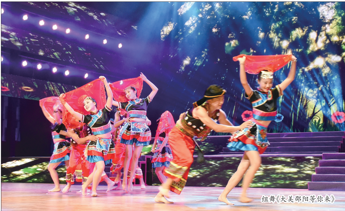
组舞《大美邵阳等你来》