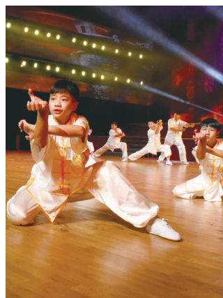
武术、瑜伽表演《刚柔并济》

“欢乐潇湘”群众文艺汇演活动自今年3月启动，在全市范围内掀起了一场“全民参与、全民欢乐”的群众文化艺术热潮，既活跃了群众文化生活，又积累了大量优秀的原创节目。据统计，全市共开展海选、初赛、复赛240余场，参赛节目达2300多个，参加演出的群众超过4万人，真正做到了来源基层，反映基层，是百姓生活的大舞台。