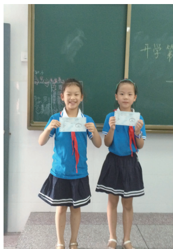
9月1日,邵阳师范学校附属小学的孩子们迎来了新学期的第一天。这是一个喜悦的开端,小记者们收到了第一张稿费单。