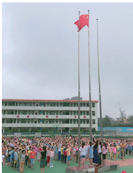
9月4日,华竹小学全体师生齐聚操场,共同参加新学期首次“向国旗敬礼”升旗仪式。