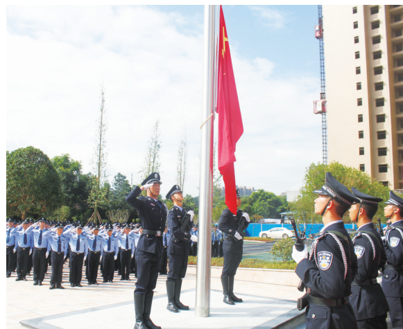
7月19日上午,由大祥公安分局270名民警和辅警组成的四个方阵,在西湖南路孙家山路段新业务技术大楼前举行升国旗仪式。该局新业务技术用房于当天正式启用。

纷结合实际,将校园足球运动融入校园体育及德育工作中,通过校内校际联赛、足球啦啦操、足球特色课程等,让一大批学生爱上校园足球运动,并在足球运动中成长、提高。几年来,我市多支校园足球队参加省级校园足球比赛获得佳绩,获得首批“全省校园足球布局城市”殊荣。