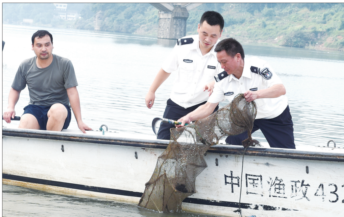
7月19日,新邵县畜牧水产局组织渔政执法人员在资江清理地笼。该局从4月开展资江河清江行动以来,共抓获非法电鱼26起,抓获麻鱼船6艘,刑事拘留4人。

据悉,当期开出红球号码03、08、14、20、24、26,蓝球号码12。中奖站点为大祥区学院路马鞍石投注站43099469。该幸运彩民喜获双色球当期一等奖,揽获奖金6005980元。