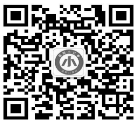
邵阳日报社小记者协会